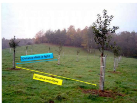
Distance de plantation pour un verger en hautes-tiges entre les arbres et les lignes.

La distance de plantation dépend d'une part, du développement de la future couronne qui dépend lui-même de l'espèce, de la variété et de la vigueur du porte-greffe et d'autre part, de facteurs externes comme le climat, le sol ou l'exposition.