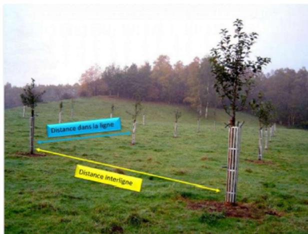
Distance de plantation pour un verger en haute-tiges entre les arbres et les lignes.

La distance de plantation dépend d'une part, du développement de la future couronne qui dépend lui-même de l'espèce, de la variété et de la vigueur du porte-greffe et d'autre part, de facteurs externes comme le climat, le sol ou l'exposition.